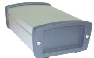
STI-Gehäuse mit Abschlussplatten aus Alu-Druckguss, inkl. Dichtung